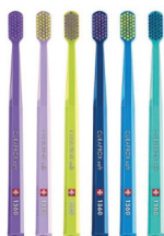
Зубная щетка CURAPROX 1560