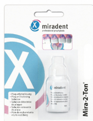
Индикатор зубного налёта Miradent Mira-2-Ton