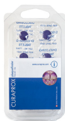
Таблетки для индикации зубного налёта Curaprox PCA 223