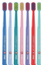
Зубная щетка CURAPROX 3960