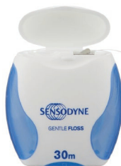
Зубная нить Sensodyne