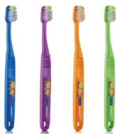
Зубная щетка Vitis Junior 6+