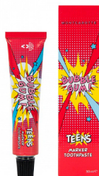
Зубная паста-маркер Montcarotte Teens Bubble Gum, 30 мл