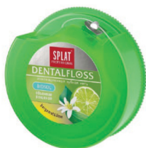
Зубная нить Splat