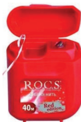
Зубная нить ROCS

Для ребёнка лучше выбрать вощеную зубную нить. Она объемнее и ей проще вычищать межзубной промежуток, который у маленьких детей может быть большим.