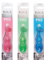
ROCS pro baby 0+