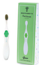
Moncarotte kids 0+