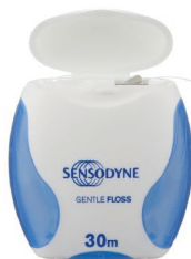
Зубная нить Sensodyne